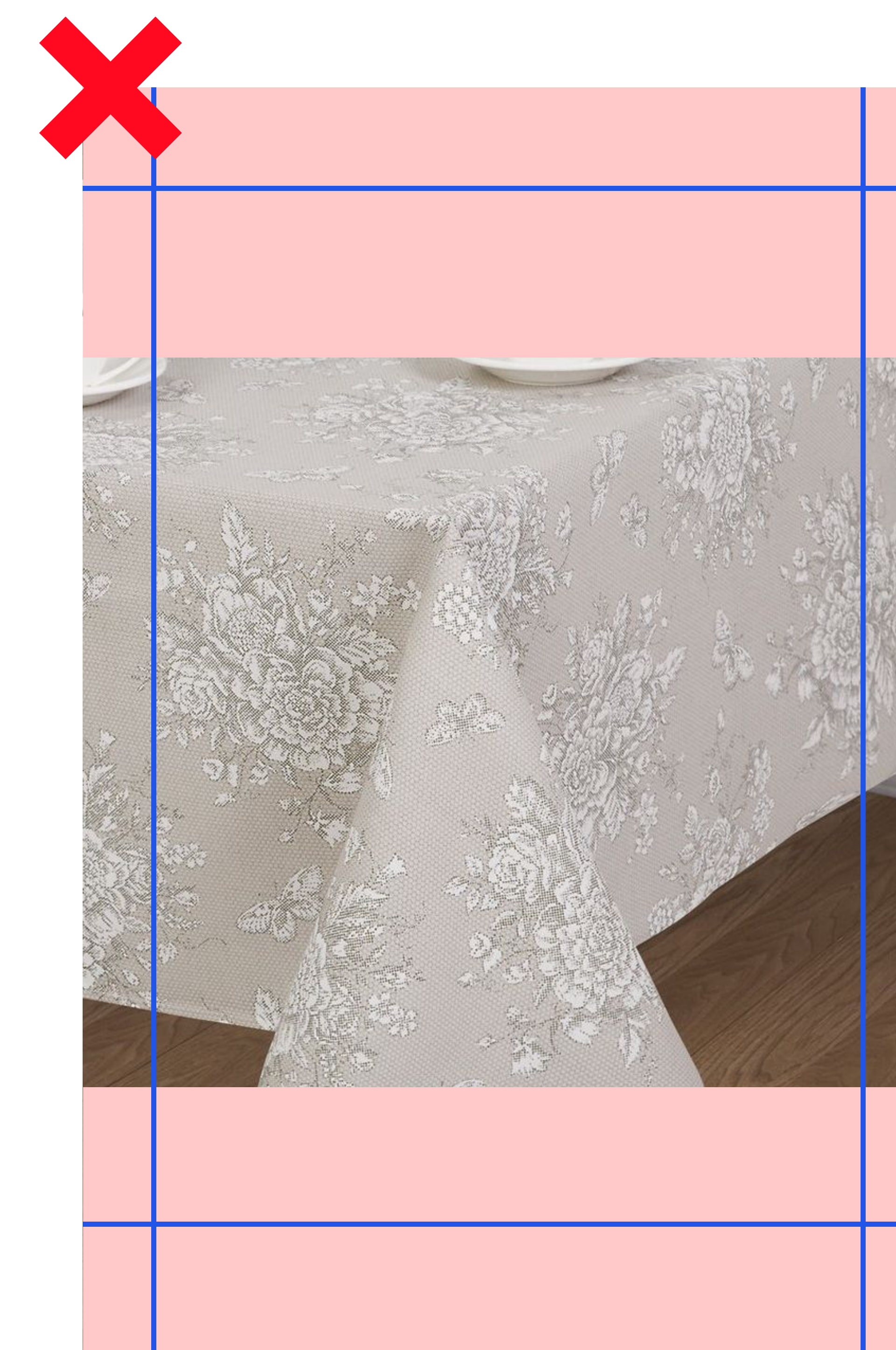
Неверно. Не допускаются полосы по краям